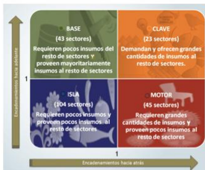
Gráfico No. 1 MATRIZ INSUMO PRODUCTO 2012 Clasificación de las 245 actividades económicas